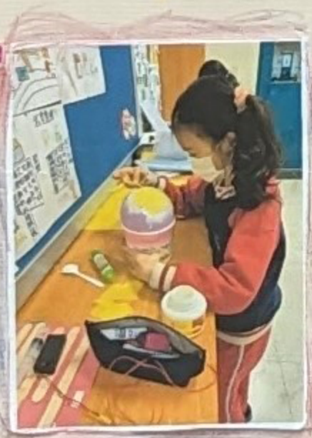
把撕碎的紙貼上氣球。