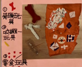
① 骨頭玩具 ② 紋線玩具 ③ 零食玩具

在這次的探究中，我發現了實際操作比預想中還要難，例如：我一開始認為只要縫一次就可以了，但是之後給狗狗試玩時，玩具一下子就被破壞了，我才了解狗的破壞力很大，又再縫了第二次。我覺得縫東西是件要練習的事才會縫出精緻的作品。很开心自己能完成四個狗玩具。