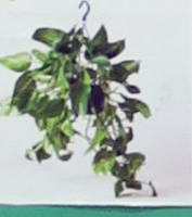
只要有足夠的支撐物,黃金葛的莖葉可以爬到二十公尺以上唷!!

名稱: 黃金葛。 科名: 天南星科 又稱: 萬年青、綠蘿。 原產地: 所羅門群島 黃金葛可以忍受日曬也不怕陰暗。葉片形狀像個愛心。越往上長的莖和葉子會長越大,而向下垂掛的莖和葉子則會變小;此外,黃金葛的莖節處會長出「氣(生)根」,靠著吸收空氣中的水分就可以持續成長,並吸附在其他表面,所以黃金葛可以攀附在木棍、欄杆或牆壁,也能沿著桌面或地面水平方向成長。